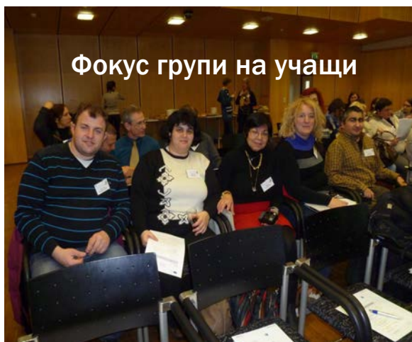
Фокус групи на учащи

Обсъждането на техните истории и преживявания ги сплоти, това ще им позволи да се учат един от друг и да си помагат при изготвянето на препоръки. Обменът на информация и споделяне на общи чувства от една страна е емоционално, но от друга страна е от решаващо значение за премахване на бариерите.