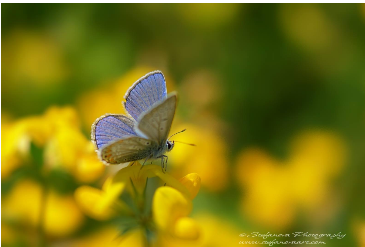
екипът на НФРИ