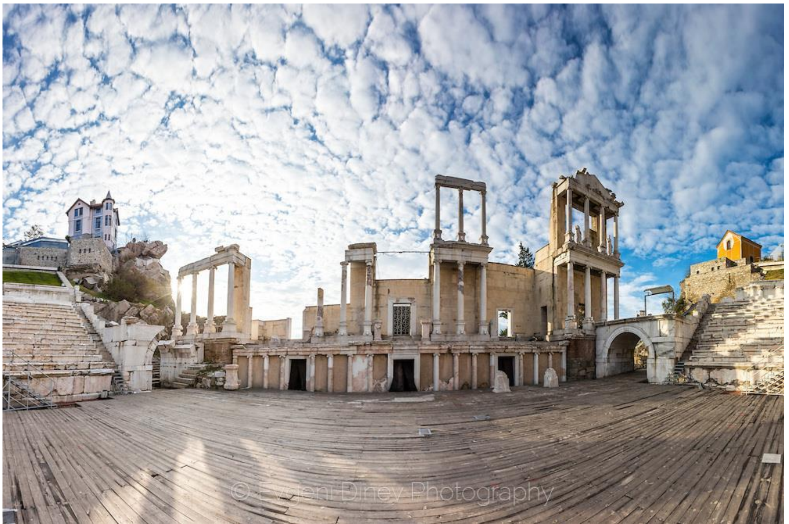
Античен театър в Пловдив