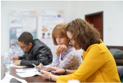
Благоевград, 12-13 октомври 2018