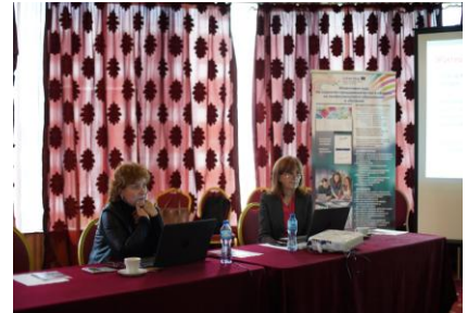
Бургас, 26-27 октомври 2018 г