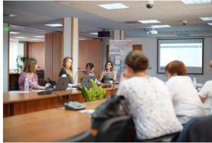
София, 19-20 октомври 2018 г.